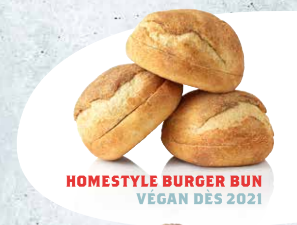
HOMESTYLE BURGER BUN VÉGAN DÈS 2021

VÉGAN, UNE OFFRE COMPLÈTE AUPRÈS D'UN SEUL FOURNISSEUR