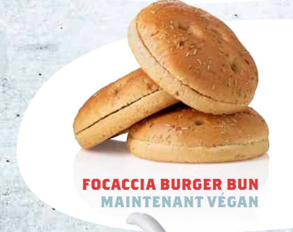
FOCACCIA BURGER BUN MAINTENANT VÉGAN