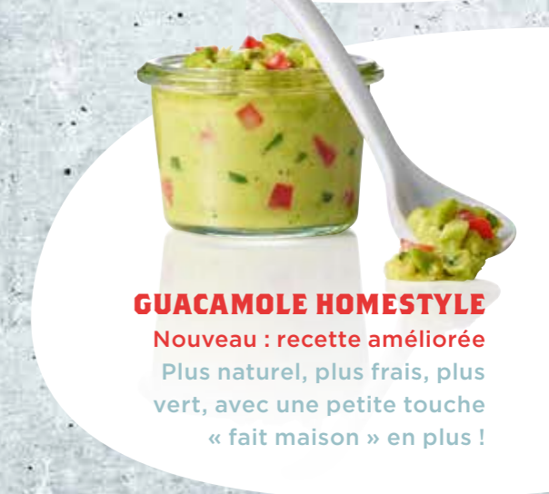
GUACAMOLE HOMESTYLE Nouveau : recette améliorée Plus naturel, plus frais, plus vert, avec une petite touche « fait maison » en plus !