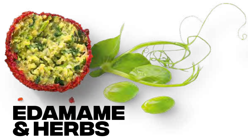
EDAMAME & HERBS