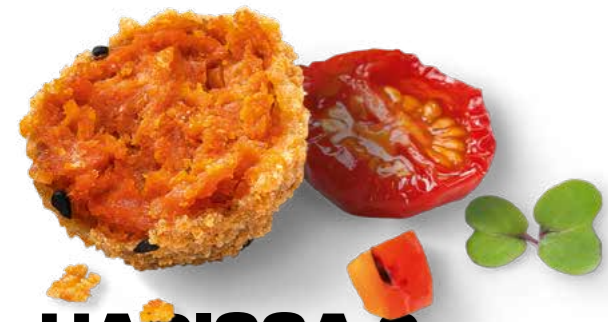
HARISSA & GRILLED PEPPER