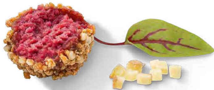
GINGER & BEETROOT

UN EN-CAS À DÉGUSTER DE MILLE FAÇONS : GRÂCE À NOS FALAFELS MULTICOLORES PROPOSÉS EN TROIS COULEURS ET SAVEURS, LA BALLE EST DANS VOTRE CAMP ! DES INGRÉDIENTS TENDANCE PERMETTENT D'OBTENIR DES SAVEURS ORIGINALES ET AMÈNENT DE LA COULEUR DANS LES ASSIETTES DE VOS CLIENTS, QUE CE SOIT DANS DES BOWLS, DES WRAPS OU AUTREMENT !