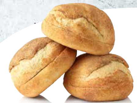
HOMESTYLE BURGER BUN DIPONIBILE DALLA PRIMAVERA 2021