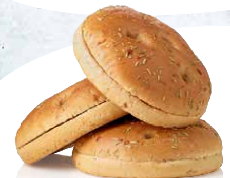
FOCACCIA BURGER BUN ORA VEGANO