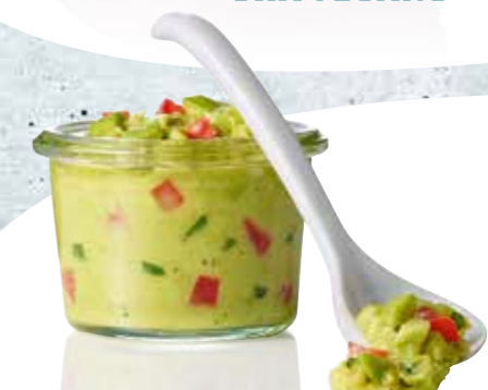
GUACAMOLE HOMESTYLE Novità: ricetta migliorata Più natura, più freschezza, più verde e con un tocco di Homestyle in più!

SOLUZIONI DALLE MILLE SFACCETTATURE PREPARATE CON PROTEINE DI DIVERSA ORIGINE. E INOLTRE BUN, SALSE E RICETTE! CON NOI LA FLESSIBILITÀ DELL'OFFERTA È GARANTITA!